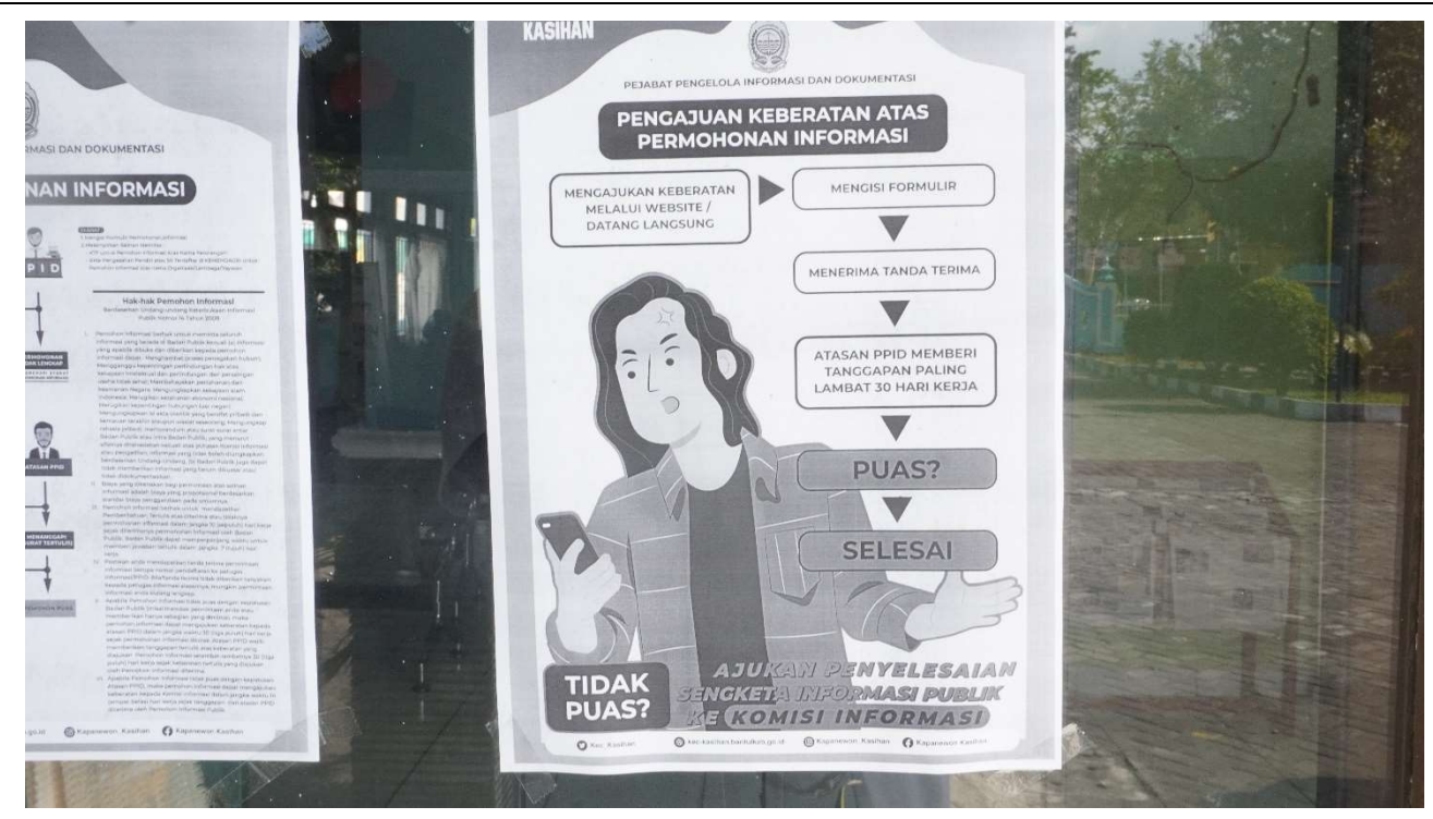
Alur Keberatan Informasi