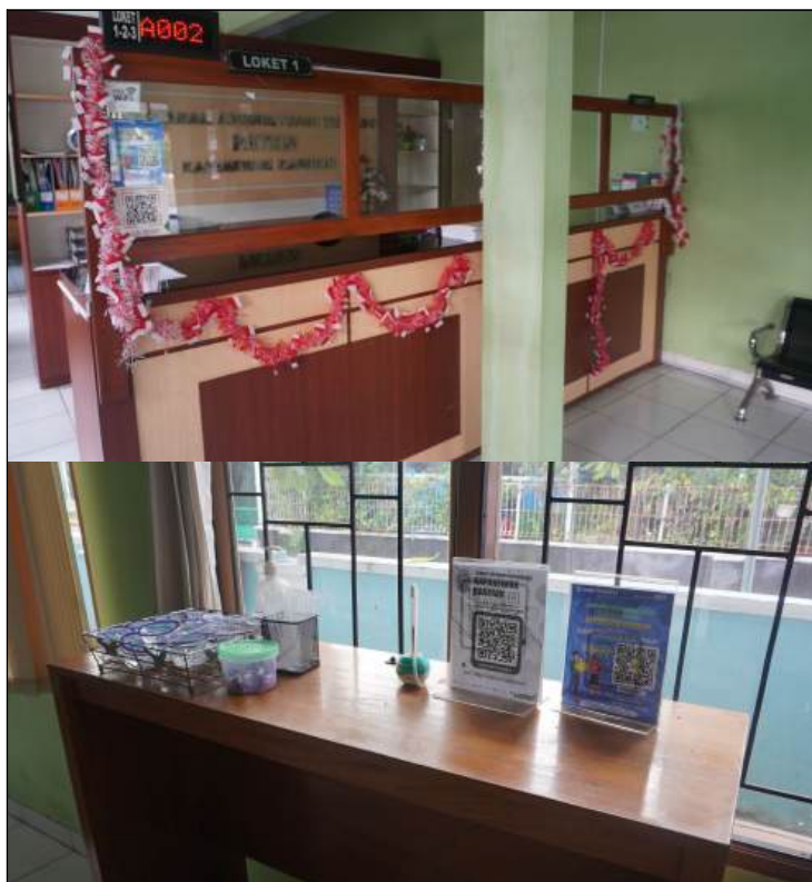
Meja dan Kursi Layanan

Fasilitas layanan informasi di kantor Kapanewon Kasihan