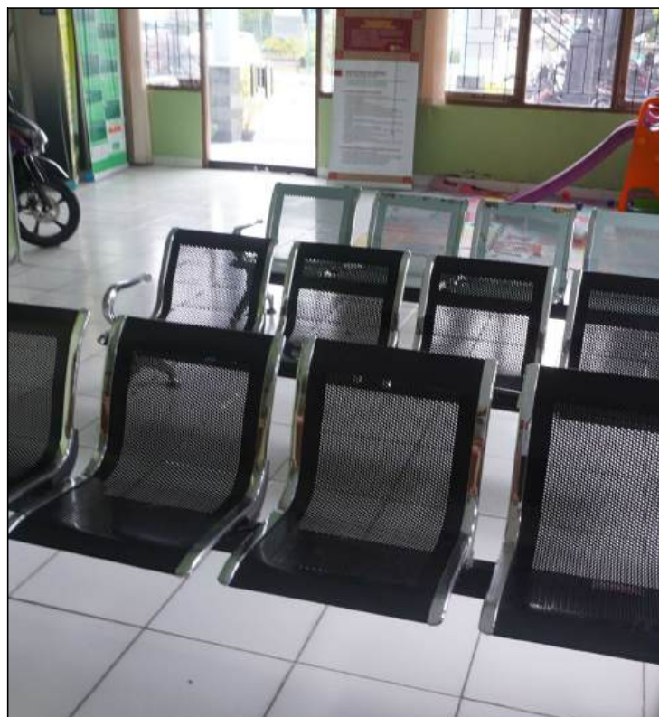
Meja dan Kursi Layanan